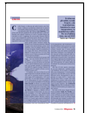
Pag: 79 - 72%