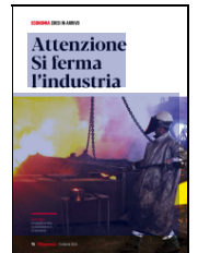
Pag: 78 - 84%